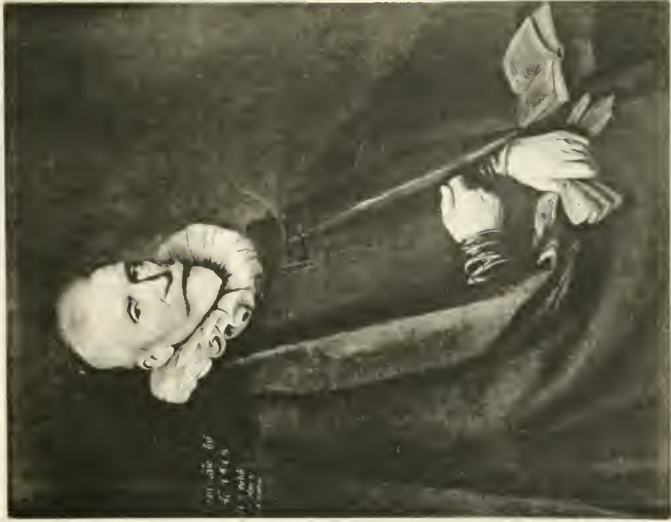
M. Jz. MIEREVELT